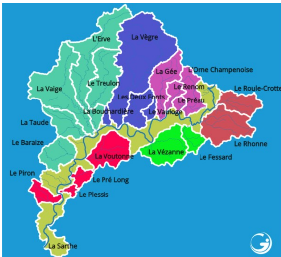
Carte des unités de gestion agrégées de l'étude de volume prélevable Sarthe aval

Liste des unités de gestion du bassin Sarthe aval (source : extrait de la délibération de la CLE Sarthe aval du 30 juin 2025) :